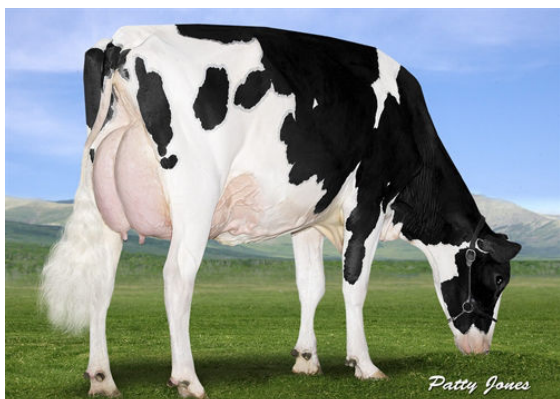
EDG RUBY UNO RIZA FOURTH DAM